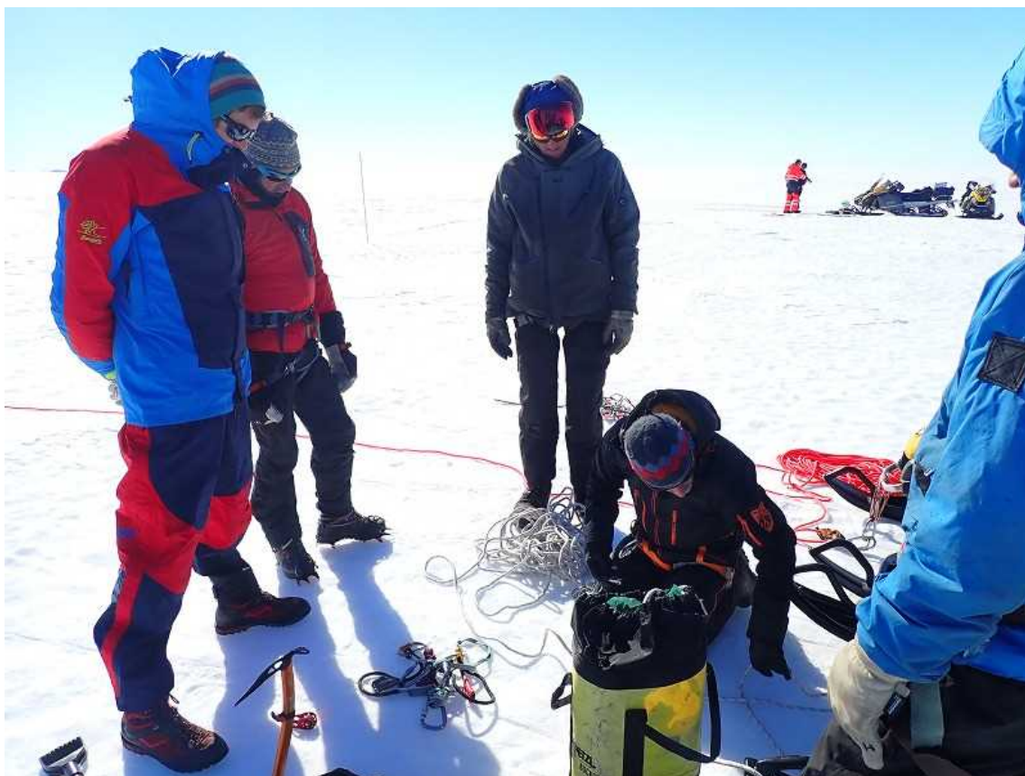
【スイス・シャモニのガイドによる、 クレパスレスキュー訓練引き上げシステム説明の様子】

実際に30mほどクレパスに入り引き上げシステムで引き揚げてもらいます、訓練もそれなりに有意義なのですが、南極のクレパスの中を覗ける醍醐味も体験できます！！