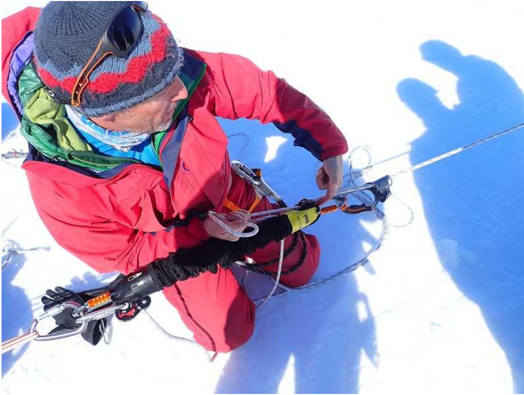
【PETZL社製のクレパスレスキュー専用用具】